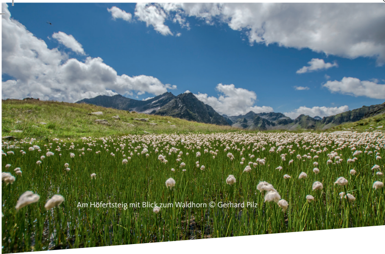
Am Höfertsteig mit Blick zum Waldhorn