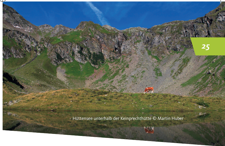
Hüttensee unterhalb der Keinprechtütte