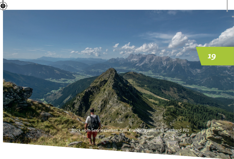
Blick vom Seerieszinken zum Kraibergzinken