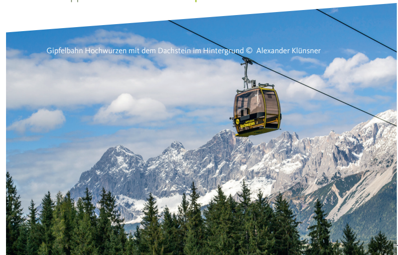
Gipfelbahn Hochwurzen mit dem Dachstein im Hintergrund

Die Wanderbusse der Planai-Hochwurzen-Bahnen ins Preuneggatal, Obertal, Untertal und Seewigtal verkehren während der Sommercard-Saison (Ende Mai bis Ende Oktober) täglich. Fahrpläne erhältst Du als Broschüre in den Infobüros des Tourismusverbandes, in der Schladming-Dachstein-App oder als PDF auf www.planaiabus.at .