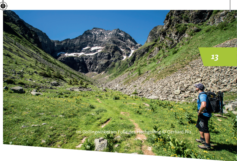
Im Gollingwinkel am Fuße des Hochgolling