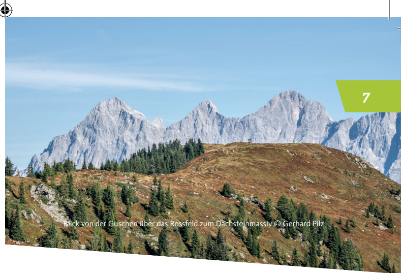
Blick von der Guschen über das Rossfeld zum Dächsteinmassiv

Zur Übernachtung stehen Dir die Giglachseehütte (1 956 m) nahe des Oberen Giglachsee oder die Ignaz-Mattis-Hütte (1 986 m) oberhalb des Unteren Giglachsee zur Auswahl.