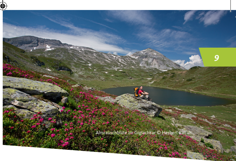
Almrauschblüte im Giglachkar