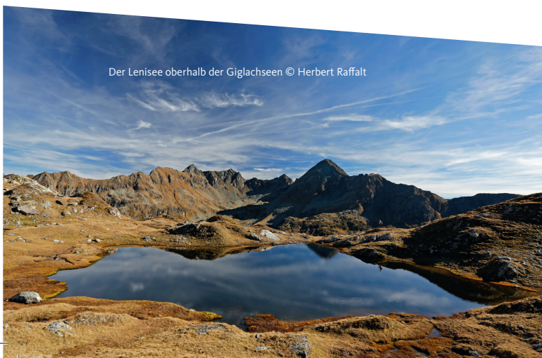
Der Lenisee oberhalb der Giglachseen

So antwortest Du: Wenn Du ein Notsignal empfangst, antworte, indem Du in einer Minute drei Zeichen (jedes im Abstand von 20 Sekunden) gibst. Dann sofort mit dem Rettungseinsatz beginnen.