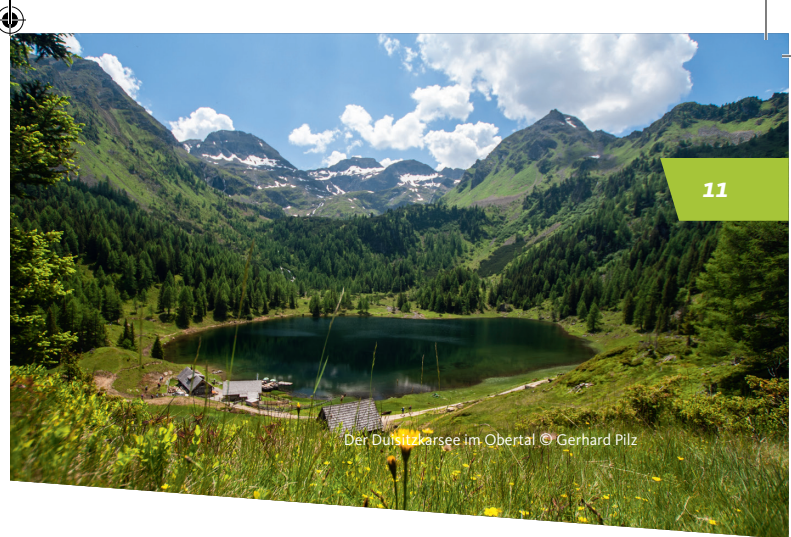
Der Duisitzkarsee im Obertal