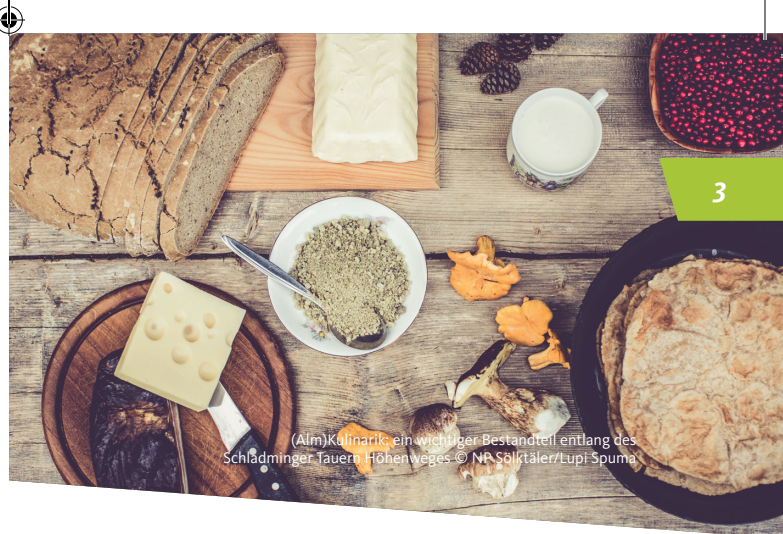
(Alm)Kulinarik: ein wichtiger Bestandteil entlang des Schladminger Tauern Höhenweges.

In dieser Broschüre ist die Tour mit Start auf der Hochwurzten beschrieben. Du kannst natürlich auch in umgekehrter Richtung wandern und das Package buchen.