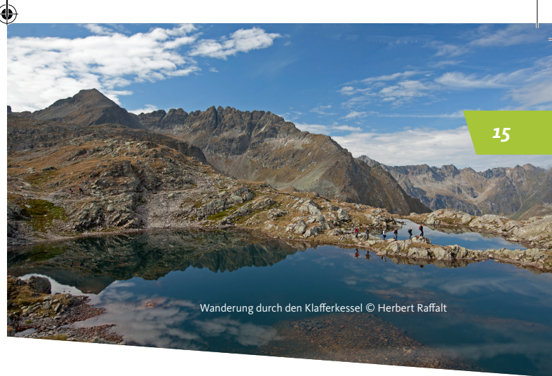
Wanderung durch den Klafferkessel

Etwas steiler bergab, wanderst Du nun durch die Lämmerkare zur Preintalerhütte und Waldhornalm .