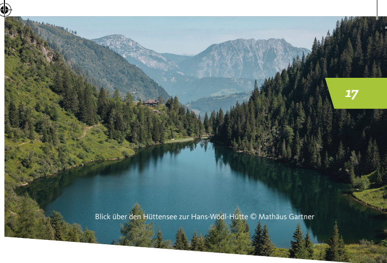
Blick über den Hüttensee zur Hans-Wödl-Hütte

Nach einer Rast und guten Jause steigst Du über den Wanderweg Richtung Steirischer Bodensee ab. Kurz bevor Du den See erreichst, kannst Du noch einen kurzen Abstecher zum Wasserfall machen. Entlang des Seeufers wanderst Du